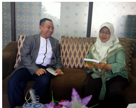
Gambar 2. Diskusi awal Tim Pengabdian dengan Kepala Sekolah SMA I

hal tersebut. Sedangkan untuk membahas tentang perhitungan pajak diperlukan Guru yang memiliki kompetensi tentang hal perpajakan, akan tetapi di SMA pada umumnya tidak memiliki Guru dengan kompetensi tersebut. Selain itu juga bahwa ujian akhir semester akan diadakan pada awal bulan Desember. Setelah wawancara dan berdiskusi dengan kepala sekolah maka Tim pengabdian masyarakat dosen-dosen LPT YAI di minta untuk dapat memberikan pencerahan tentang perhitungan pajak, dan cara mengimplementasikan dengan e-pajak, karena saat ini semua berorientasi elektronik.