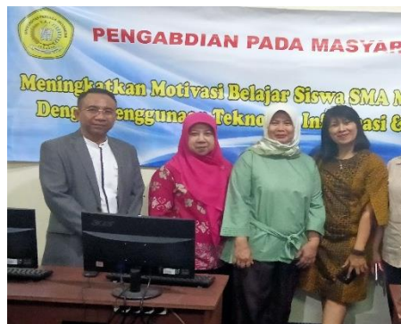
Gambar 3. Tim Pengabdian Masyarakat UPI YAI