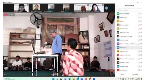
Gambar 2: Foto pada saat pemaparan materi