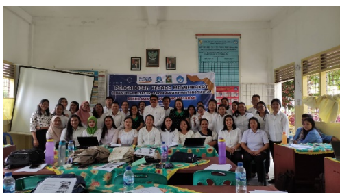
Gambar 2. Tim Pengabdian, Guru-Guru dan Mahasiswa

Dari kedua gambar di atas (gambar 1 dan 2), tim PKM melakukan sosialisasi, pelatihan dan pendampingan ke salah satu SD yang ada di Kecamatan Jorlang Hataran. Gambar 1 merupakan tim pengabdian melakukan penguatan literasi teknologi bagi guru-guru se-Kecamatan Jorlang Hataran sedangkan pada gambar 2 merupakan gambar tim PKM dengan guru-guru yang ada di Kec. Jorlang Hataran yakni dari 16 Sekolah Dasar yang ada di Kecamatan Jorlang Hataran.