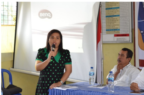
Gambar 1. Ketua Tim PKM Memberikan Sosialisasi

Ada banyak contoh penerapan teknologi dalam pembelajaran yakni dengan menggunakan media pembelajaran seperti penggunaan aplikasi Googlemeet , WhatsApps dan aplikasi lainnya yang ada pada smartphone masing-masing guru yang akan mempengaruhi hasil belajar siswa. Bahkan dalam menggunakan media visual tiga dimensi berbantuan komputer di kelas V SD juga dapat meningkatkan hasil belajar di kelas. Tentunya dari semua penerapan teknologi, setiap guru membutuhkan sebuah edukasi, penguatan, sosialisasi, pelatihan dan pendampingan agar cakap dalam menggunakan teknologi.