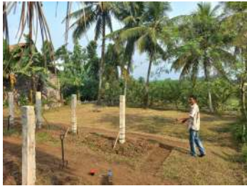
Gambar 4 : Foto Lokasi Kebun Pendidikan

pendidikan yang diharapkan menjadi sebuah ranah pendidikan mengenai beberapa ragam buah buahan serta beragam sayur sayuran. Lokasi survey ketiga ini tidak jauh dari lokasi homestay . Lokasi kebun ini terdiri dari beberapa ragam buah dan sayuran seperti : jambu kristal, pisang, buah naga, ubi, tebu dan beberapa sayur sayuran seperti gambaran lokasi pada gambar dibawah ini.