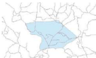
Gambar 8 : Gambar Proses Digitasi menggunakan Qgis