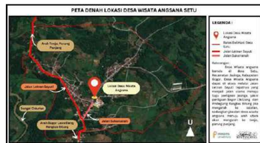
Gambar 11 : Peta Denah Lokasi Desa Wisata Angdana Desa Setu

Hasil akhir dari semua proses tahapan yang telah dilakukan sebelumnya pada program kerja program studi perencanaan wilayah dan kota (PWK) dalam program kegiatan pengabdian kepada masyarakat atau (PkM) di desa wisata angdana desa setu kecamatan jasinga menghasilkan output berupa Peta denah lokasi desa wisata angdana desa setu dan juga peta masterplan peta sebaran destinasi wisata desa wisata angdana desa setu yang di harapkan dapat mewujudkan perkembangan desa setu dalam memperkenalkan desa wisata angdana kepada dunia pariwisata. Hasil output yang di hasilkan pada program kegiatan pengabdian kepada masyarakat atau (PkM) seperti pada gambar di bawah ini.