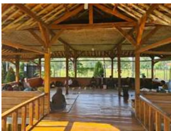
Gambar 1 : Sosialisasi di saung Villa 288

Kegiatan sosialisasi ini dilakukan guna memberi pemahaman kepada pihak pihak terkait mengenai tugas, peran, fungsi serta kegiatan dan pelaksanaan yang akan di lakukan pada pembuatan peta desa wisata angdana di desa setu dalam kegiatan pengabdian kepada masyarakat atau (Pkm). kegiatan sosialisasi ini juga menghadirkan pemerintahan desa dan tokoh masyarakat seperti dewiners atau ketua dan anggota desa wisata angdana setu guna menyamakan visi dan memperoleh masukan atau informasi mengenai proses yang akan di lakukan yang bersifat lokal dan spesifik mengenai keberlanjutan pengembangan desa wisata angdana setu di desa setu kecamatan jasinga.