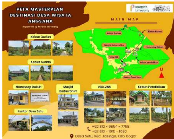
Gambar 13 : Peta Masterplan Sebaran Destinasi Wisata Desa Wisata Angsana