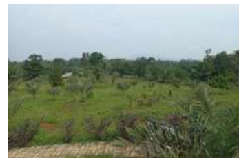
Gambar 3 : Foto Lokasi Kebun Kurma

Lokasi survey ke dua adalah lokasi kebun kurma yakni lokasi yang akan di jadikan area perkebunan kurma dengan beberapa spot atau area untuk berfoto serta area tersebut akan direncanakan di buat sebuah danau sebagai area untuk best view pada area tersebut serta menjadikannya kebun kurma ini sebagai area rekreasi berkumpul seperti pada gambar di bawah ini.