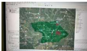
Gambar 7 : Gambar Proses Digitasi menggunakan Arcmap

Dilakukannya proses pemetaan ini guna untuk mempermudah proses proses digitasi dalam pembuatan peta. Pada Proses digitasi menggunakan beberapa aplikasi seperti Qgis dan Arcgis seperti pada gambar di bawah ini :