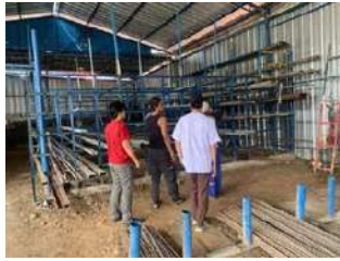
Gambar 8 : Foto pemilihan barang dan pembelian beberapa barang material

Setelah membeli beberapa bahan dan peralatan ditoko material, selanjutnya dilakukan tahap pembuatan kerangka atau penyangga dan proses pengecatan kerangka atau penyangga sebelum kerangka atau penyangga tersebut dipasangkan peta yang akan di cetak, berupa peta masterplan sebaran wisata pada desa wisata angdana desa setu.