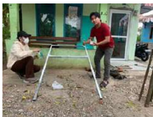
Gambar 9 : Foto Proses Pengelasan dan Pengecatan Kerangka Besi Penyangga

Setelah membeli beberapa bahan dan peralatan ditoko material, selanjutnya dilakukan tahap pembuatan kerangka atau penyangga dan proses pengecatan kerangka atau penyangga sebelum kerangka atau penyangga tersebut dipasangkan peta yang akan di cetak, berupa peta masterplan sebaran wisata pada desa wisata angdana desa setu.