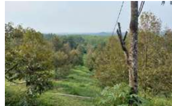
Gambar 2 : Foto Lokasi Kebun Duren

pembukaan sebagai sarana perkenalan terhadap wilayah yang akan di lakukan penelitian untuk proses digitasi. Wilayah pertama yang akan di survey seperti lokasi kebun duren yakni lokasi yang akan di jadikan perkebunan dengan beberapa aktrasi seperti wahana track atv dan wahana flanying fox seperti pada gambar di bawah ini.