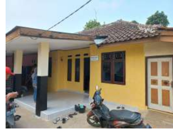
Gambar 5 : Foto Lokasi HomeStay

berniat untuk lebih lama dan menginap di desa wisata angšana untuk beberapa saat, untuk situasi lokasinya seperti ada gambar di bawah ini.