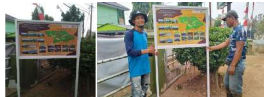
Gambar 10 : Foto Pemasangan Tiang Penyangga Peta Masterplan

penanaman kerangka atau tiang penyangga tersebut. Penanaman atau pemasangan tiang penyangga peta ini bertujuan agar para wisatawan dapat melihat peta tersebut dikarenakan lokasi kantor desa setu sendiri berada pada akses utama yakni jalan utama desa setu Jalan Sukamanah.