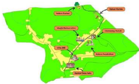
Gambar 12 : Peta Utama