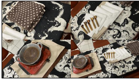
Gambar4. Perlengkapan membuat batik

Menggambar pola motif sebagai langkah awal dalam membuat Batik, kemudian bila pola telah selesai dilakukan proses mencanting dengan lilin dan malam (Gambar 5).