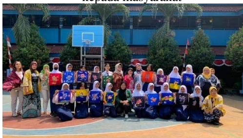
Gambar 10. Hasil Karya Membatik di SMP Negeri 158, Jatinegara Kaum

Antusiasme peserta didik dalam mengikuti kegiatan cukup besar. Namun, ketika kelas daring untuk memberikan materi tambahan Sejarah Batik dan produk-produk Batik, peserta didik kurang termotivasi sehingga hanya beberapa peserta didik yang mengikuti kelas daring tersebut.