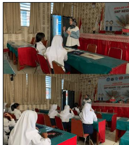
Gambar3. Penyampaian materi berupa Sejarah Batik dan Nilai Tradisional

Proses contextual teaching and learning (CTL) dimulai dengan memberikan materi mengenai sejarah Batik, pola-pola Batik, manfaat membatik, modernisasi Batik yang sudah ada di Indonesia (Lihat gambar 3).