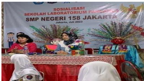
Gambar 9. Sambutan kegiatan pengabdian kepada masyarakat

Rangkaian kegiatan ditutup dengan evaluasi proses, hasil kegiatan (Gambar 9), dan dokumentasi (Gambar 10). Selain itu, disampaikan kontinuitas kegiatan dengan kelas daring untuk melanjutkan proses contextual teaching and learning (CTL).