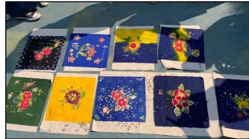
Gambar7. Pengeringan Karya Batik

Tahap selanjutnya (gambar 7) yakni mengeringkan Batik yang sudah diwarnai. Selama pengeringan, dianjurkan di bawah terik matahari, serta dibiarkan terkena angin agar lebih cepat kering.