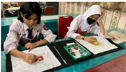
Gambar6. Mewarnai batik dengan perpaduan warna primer

Proses membuat batik dilanjutkan dengan memberikan warna pada pola yang sudah dibuat. Pewarnaan menggunakan warna-warna dasar dan peserta didik bebas memilih warna yang diinginkan sesuai kreativitasnya. Pewarnaan menggunakan kuas warna khusus kain (Gambar 6).