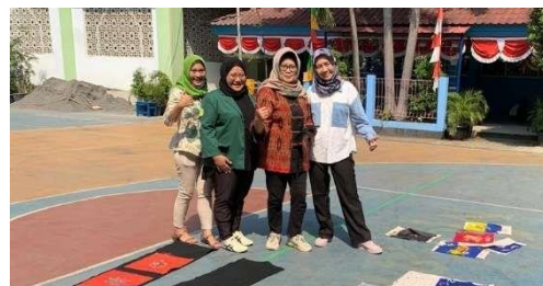
Gambar9. Pengeringan karya Batik dan finalisasi di halaman SMP Negeri 158, Jatinegara Kaum.

Setelah kain dipastikan bersih dari lilin dan malam, karya-karya Batik tersebut dijemur kembali sebagai proses akhir membuat batik, hingga kering (Gambar 9).