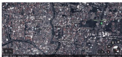
Gambar1. Tingkat kepadatan wilayah sekitar SMPN 158 Jakarta

Sampel dipilih sesuai dengan minat peserta didik terhadap membatik. Di tahun 2021 – 2022, pelatihan terdiri dari 35 peserta didik. Namun demikian, peserta didik yang kurang tertarik terhadap batik, dan karya hasil membatiknya dinilai belum optimal, tidak diikutsertakan kembali dalam kegiatan tahun anggaran 2023.