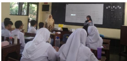
Gambar 6. Pematerian