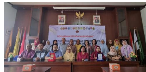
Gambar 5. Foto bersama Tim PKM UPI YAI dan AA YAI dengan jajaran SMA YAPEMRI .