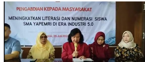
Gambar 3. Pembukaan kegiatan dilakukan di Aula SMA YAPEMRI Tampak Ketua Yayasan YAPEMRI saat memberi Sambutan

kelompok yang membutuhkan pemahaman lebih mendalam tentang literasi manajemen keuangan, khususnya dalam hal pengelolaan keuangan pribadi.