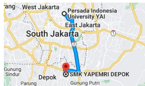
Gambar 1. Lokasi Mitra

Melalui kegiatan ini, diharapkan para siswa dapat tidak hanya memahami konsep dasar pengelolaan keuangan, tetapi juga mampu mengaplikasikannya dengan bijak dan tepat guna dalam menghadapi tantangan finansial di era digital yang terus berkembang (Effendi et al., 2023; Sari & Listiadi, 2021).