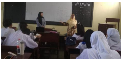
Gambar 7. Pematerian

Metode pre-test dan post-test digunakan untuk mengukur pemahaman siswa sebelum dan sesudah penyuluhan. Hasil pre-test menunjukkan bahwa pengetahuan siswa mengenai manajemen keuangan masih sangat terbatas. Namun, setelah penyuluhan selesai, hasil post-test