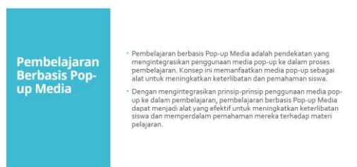
Gambar 4. Materi Pembelajaran Guru