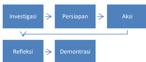
Gambar 1. Tahapan Pelaksanaan

Service Learning dimulai dengan analisis dan tinjauan realitas untuk menentukan intervensi mana yang dapat dilakukan untuk memperbaiki kekurangan yang teridentifikasi (Sari & Heriyawati, 2020). Tahap-tahap pelaksanaan Service Learning tergambar pada Gambar 1.