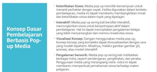
Gambar 5. Materi Pembelajaran Guru