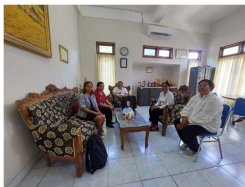
Gambar 2. Sosialisasi Awal Kegiatan

Gambar 2 memuat dokumentasi dari tahapan Investigasi dan persiapan kegiatan.