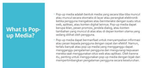
Gambar 3. Materi Pembelajaran Guru

Gambar 3 hingga Gambar 6 merupakan materi pembelajaran berbasis pop-up media untuk guru pendamping ABK Tuna Grahita di SLB Negeri 1 Badung.