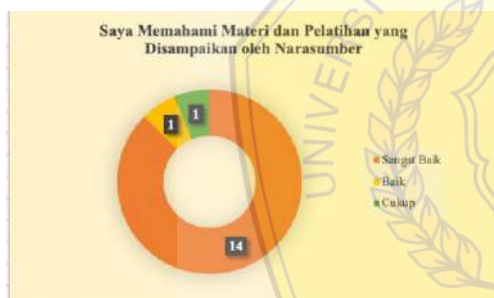
Gambar 5. Pemahaman Peserta Terkait Dengan Materi dan Pelatihan yang Disampaikan oleh Narasumber

Terdapat beberapa pernyataan yang disebar oleh Tim PKM dengan kuesioner. Pada pernyataan pertama diperoleh hasil bahwa 14 peserta menjawab sangat baik mengenai pemahaman peserta tentang materi dan pelatihan yang diberikan oleh narasumber dan juga terdapat jawaban baik dan cukup terkait pernyataan tersebut yang masing-masing berjumlah 1 orang. Hasil kuesioner tersebut dapat dilihat pada gambar 5: