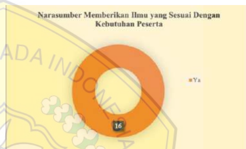
Gambar 7. Narasumber Memberikan Ilmu yang Sesuai Dengan Kebutuhan Peserta

Penting untuk kegiatan Pengabdian Kepada Masyarakat (PKM) ini dapat memenuhi kebutuhan dari Kelompok Wanita Tani (KWT) D'Shafa, sehingga Tim PKM perlu memastikan bahwa ilmu ataupun pengetahuan yang diberikan oleh narasumber sesuai dengan kebutuhan peserta PKM. Terkait dengan hal tersebut Tim PKM mendapatkan hasil kuesioner seperti yang terdapat pada gambar 7: