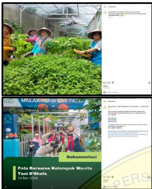
Gambar 2. Konten di Media Sosial Instagram