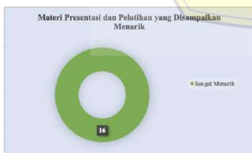
Gambar 6. Hasil Kuesioner Mengenai Materi Presentasi dan Pelatihan yang Disampaikan Menarik

Berikutnya pada pernyataan kedua, Tim PKM menanyakan perihal materi presentasi dan pelatihan yang disampaikan menarik. Dari 16 kuesioner