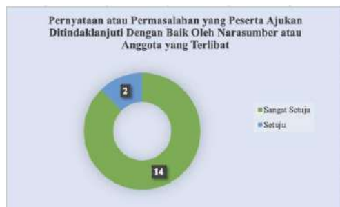
Gambar 8. Pernyataan atau Permasalahan yang Peserta Ajukan Ditindaklanjuti Dengan Baik Oleh Narasumber atau Anggota yang Terlibat

Pada kegiatan Pengabdian Kepada Masyarakat (PKM) ini juga dibahas lebih lanjut dalam diskusi serta tanya jawab terkait dengan konten media sosial yang sudah selama ini dibuat oleh Kelompok Wanita Tani (KWT) D'Shafa. Narasumber dan tim PKM turut memberikan saran mengenai apa saja yang perlu ditambahkan agar konten tersebut bisa lebih menarik lagi untuk dilihat khalayak luas. Para peserta juga aktif dalam menanggapi setiap pertanyaan atau bahan diskusi yang diberikan oleh narasumber. Saat pelatihan peserta juga interaktif ketika dijelaskan proses produksi konten promosi di media sosial dengan praktik langsung menggunakan handphone .