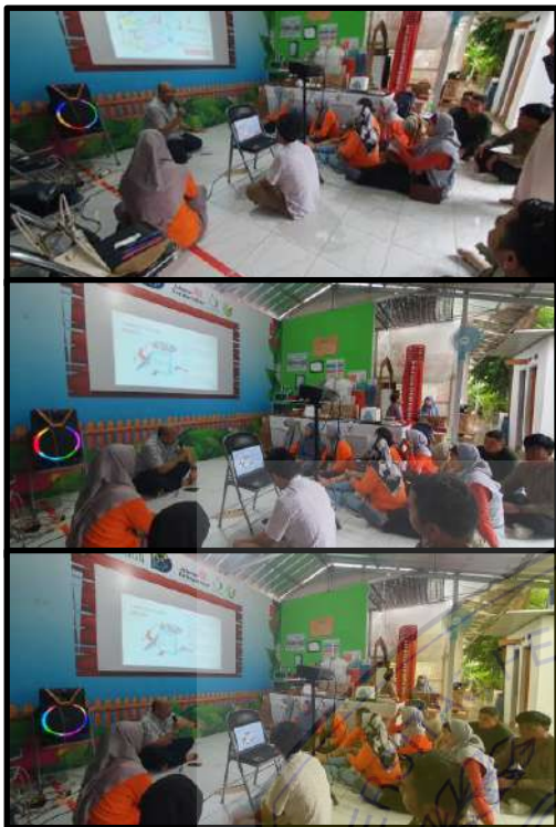
Gambar 4. Pemaparan Materi Produksi Konten Promosi di Media Sosial

Dalam menyampaikan materi ini juga digunakan metode diskusi mengenai bagaimana Kelompok Wanita Tani (KWT) D'Shafa memproduksi konten promosi yang selama ini sudah mereka lakukan yang kemudian dilanjutkan dengan saran kepada Kelompok Wanita Tani (KWT) D'Shafa ke depannya tentang bagaimana sebaiknya dalam merencanakan, menyusun, dan meng- upload konten promosi agar followers ataupun pengguna media sosial lainnya yang belum menjadi followers menjadi tertarik dengan promosi yang di- upload di media sosial Kelompok Wanita Tani (KWT) D'Shafa.