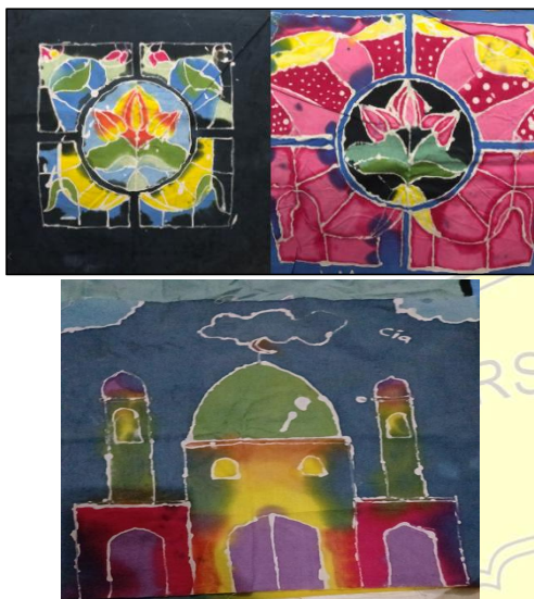
Gambar 2. Pengembangan Motif Sejarah dengan Tema Kaca Patri dan Masjid, Jatinegara Kaum

memperkenalkan keterampilan membatik kepada siswa, tetapi juga menghubungkan nilai-nilai sejarah lokal yang terkandung dalam setiap motif Batik (Gambar 2).