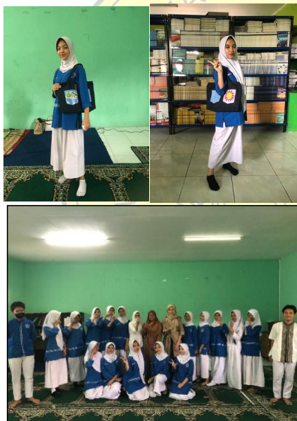
Gambar 6-8. Hasil Penilaian Berdasar Evaluasi oleh Tim Dosen P2M

Hasil penilaian keterampilan (Gambar 5), sekitar 70% peserta didik berhasil menghasilkan karya Batik dengan teknik yang benar setelah mengikuti pelatihan. Meskipun hasil yang dihasilkan bervariasi, banyak peserta didik menunjukkan peningkatan kemampuan dalam hal kreativitas dan teknik dasar pembuatan batik. Hasil Batik yang dibuat peserta didik dijadikan motif tas sehingga menjadi lebih real dan cantik.