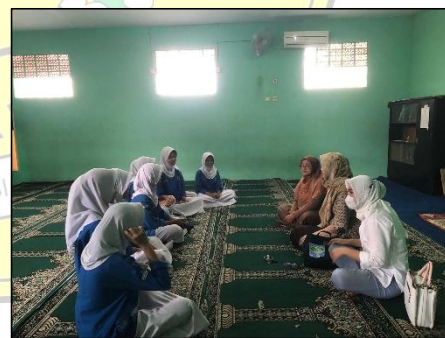
Gambar 5. Kegiatan Evaluasi Hasil Batik