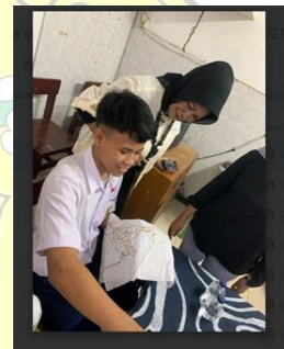
Gambar 4. Kegiatan Praktek Membatik

Peningkatan pemahaman peserta didik mengenai batik berbasis Sejarah lokal berdasarkan hasil wawancara yang kemudian diolah dalam bentuk persentase, 85% peserta didik melaporkan bahwa mereka lebih memahami sejarah Batik Jatinegara Kaum setelah mengikuti kegiatan eduwisata. Sebagian besar peserta didik menyatakan bahwa materi yang disampaikan melalui kombinasi teori dan praktik lebih efektif dalam meningkatkan pemahaman.