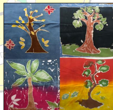
Gambar 1. Motif Pohon Jati Ciri Jatinegara Kaum

Peserta didik SMP Garuda Jatinegara Kaum menunjukkan minat dan keterlibatan yang tinggi dalam pengembangan kegiatan eduwisata. Peserta Pengabdian kepada Masyarakat tersebut, sangat antusias untuk menggali pengetahuan dan keterampilan dalam pembuatan Batik. Peserta didik menjadi lebih mengenal dan memahami Batik, baik dari segi sejarah, filosofi, hingga teknik pembuatannya. Banyak peserta didik yang sebelumnya tidak mengenal Batik lokal kini mampu menjelaskan motif-motif khas Jatinegara Kaum dan makna di baliknya (Gambar 1).