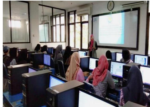
Gambar 1. Suasana Kelas Pada Saat Pelatihan Berlangsung

insert video dan mencetak slide power point ke printer.