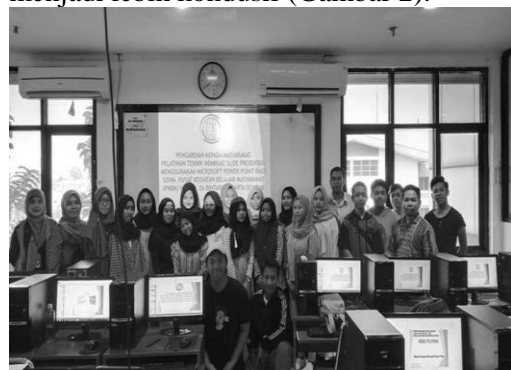
Gambar 2. Sesi Foto Bersama Setelah Selesai Pelatihan

Pelatihan ini memberikan materi Microsoft Power Point sebagai upaya menunjang keterampilan membuat slide untuk presentasi sehingga dapat menambah pengetahuan dibidang komputer. Materi yang disajikan oleh tim pelaksana pengabdian dapat diterima, dicerna dan dipahami peserta dengan baik. Jumlah peserta yang hadir sesuai dengan jumlah tim pelaksanaan pengabdian kepada masyarakat yang berperan sebagai instruktur dan asisten instruktur menjadikan pelatihan ini menjadi lebih kondusif (Gambar 2).