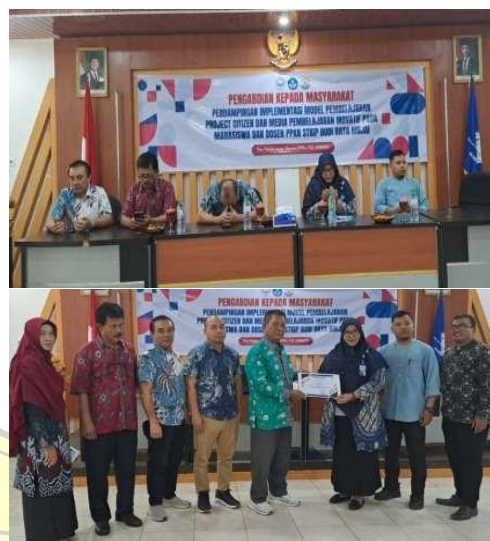
Gambar 4.1. Dokumentasi Kegiatan

Pada sesi kedua, kegiatan difokuskan pada Pelatihan Media Pembelajaran PPKn Inovatif. Pelatihan ini bertujuan untuk meningkatkan kreativitas mahasiswa dalam merancang dan memanfaatkan media pembelajaran yang menarik, interaktif, dan sesuai dengan kebutuhan pembelajaran abad ke-21. Melalui kegiatan ini, mahasiswa diharapkan mampu mengembangkan proses pembelajaran yang lebih efektif, inovatif, dan berorientasi pada keterlibatan aktif peserta didik.