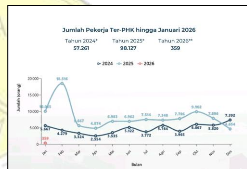
Gambar 1. Jumlah Tenaga Kerja yang mengalami PHK sepanjang 2024-2026