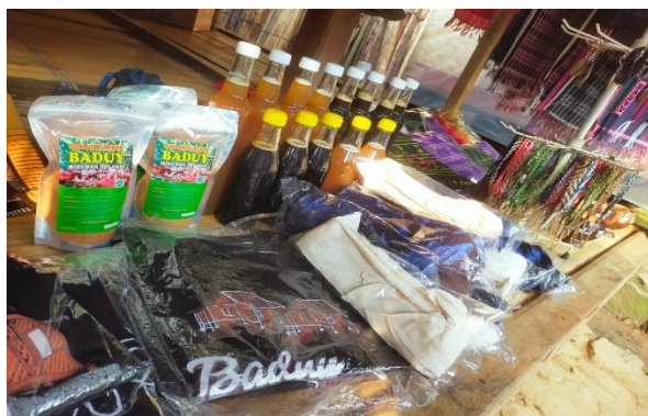
Gambar.2 Madu odeng, madu nyiruan, gula aren bubuk