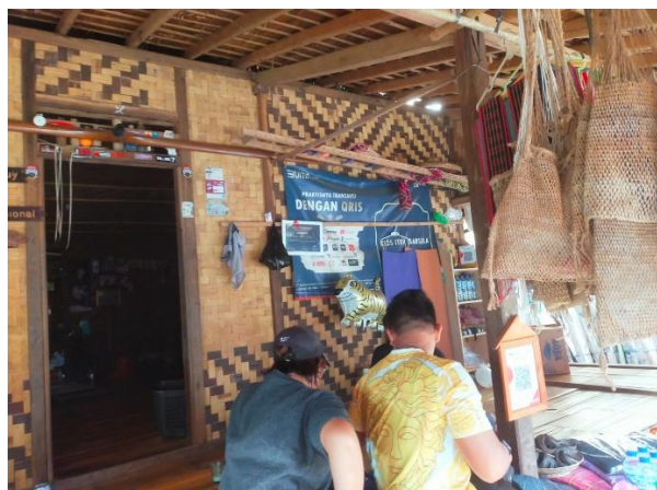
Gambar.8 Pengunjung telah melakukan pembayaran menggunakan QRIS