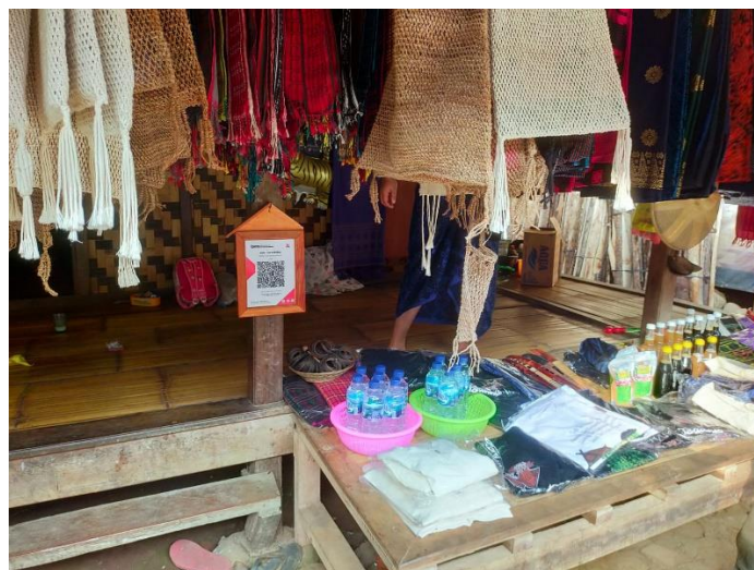
Gambar.3 Barcode QRIS untuk memudahkan konsumen