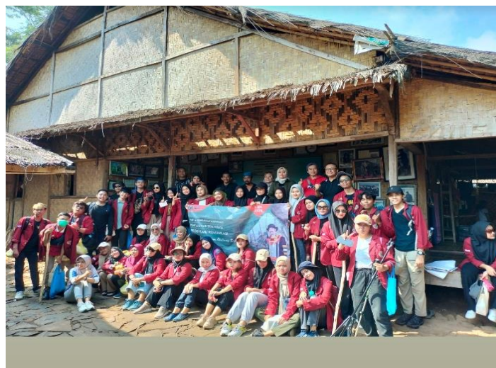
Gambar.4 Foto Bersama setelah Sosialisasi di Kantor Desa Kanekes