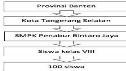
Gambar 2. Skema Pengambilan Sampel

Teknik pengambilan sampel dalam penelitian ini adalah simple random sampling yaitu pengambilan anggota sampel dari populasi dilakukan secara acak tanpa memperhatikan strata yang ada dalam populasi dengan menggunakan penentuan jumlah sampel dari populasi tertentu yang dikembangkan dari Issac dan Michael dengan taraf kesalahan 5%. Berdasarkan tabel tersebut, apabila jumlah populasi 139, maka sampel yang diambil sebanyak 100 orang (Sugiyono, 2016: 87). Adapun prosedur pengambilan sampel adalah sebagai berikut :