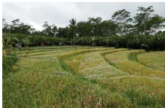
Gambar 9. Lahan Persawahan

Tradisi budaya yang dijadikan atraksi wisata di Ekowisata Pancoh yaitu Wiwitan. Tujuan pelaksanaan upacara adat ini yaitu sebagai wujud syukur petani dikasi panen yang melimpah, terimakasih kepada Sang Penguasa untuk sedekah dan memberikan makanan ke masyarakat sekitar. Makanan yang disajikan berupa nasi, lauk pauk, telur, jajanan pasar dan ayam. Pada aktivitas wisata ini wisatawan ikut dari penyajian awal di rumah untuk prosesnya dan ikut memasak. Setelah sesajian selesai dibuat wisatawan akan diajak ke ladang persawahan untuk melaksanakan upacara wiwitan. Tradisi wiwitan dapat dilakukan oleh wisatawan, menyesuaikan dengan waktu panen padi. Setelah upacara adat selesai, wisatawan akan diajak makan bersama dan selanjutnya dapat ikut paket wisata untuk panen padi. Selain tradisi wiwitan, di Desa Ekowisata Pancoh juga dapat belajar membuat sesajian dan mengikuti upacara adat Jawa lainnya seperti Mitoni dan Nyadran