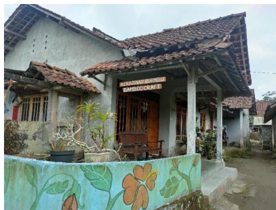
Gambar 11. Lokasi membuat Kerajinan Bambu

lingkungan hidup) dengan pendampingan secara continue . Dari aspek pariwisata berkelanjutan dapat dilihat Ekowisata pancoh dapat berlanjut sampai generasi berikutnya dengan melakukan regenerasi pengelolaan kepada para pemuda-pemudi desa. Para orang tua hanya sebagai penasehat dan ikut membantu jika terjadi masalah dalam pengelolaan wisatanya. Selain itu Ekowisata Pancoh juga menggunakan produk ramah lingkungan dengan memanfaatkan limbah plastik menjadi kerajinan tangan. Wisatawan juga dapat membuat kerajinan berupa anyaman bambu serta Caping Art . Caping Art yaitu aktivitas untuk melukis topi petani dari bambu.