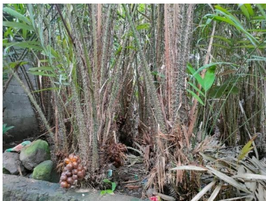
Gambar 2. Kebun Salak

Aktivitas wisata di Kebun Salak yaitu edukasi budidaya salak seperti cara mencangkok, cara penyerbukan, cara mengupas salak yang benar, cara membatat untuk mengurangi pelepas dan berapa yang disisakan untuk dapat tumbuh dan berbuah dengan baik. Pengolahan salak ditujukan untuk meningkatkan harga salak dari yang hanya Rp.3.000 menjadi Rp.35.000. Edukasi pengolahan salak untuk ekonomi masyarakat dapat terangkat. Kegiatan wisata kebun salak perpaket Rp. 20.000 per orang dan Rp. 15.000 perorang jika jumlah wisatawan cukup banyak. Wisatawan diajak untuk membuat olahan makanan dari salak seperti dibuat eggroll, wajik, wingko, manisan salak, dan kerupuk salak. Pengerjaan kuliner salak ada timnya sendiri oleh masyarakat lokal dan pemuda desa kurang lebih 4 sampai 5 orang dan bergantung pada jumlah wisatawan.