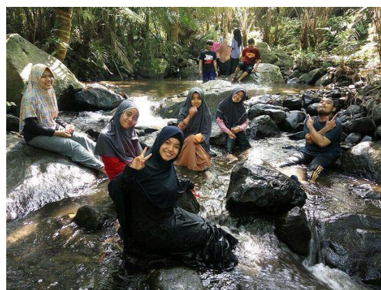
Gambar 6. Susur Sungai

Tidak ada peralatan khusus yang dibutuhkan karena debit air yang cukup dangkal. Wisatawan hanya disarankan untuk menggunakan pakaian yang nyaman serta menggunakan alas seperti sandal. Sandal yang digunakan pun sandal gunung yang aman ketika berpijak pada batu yang berlumut. Daerah Pancoh termasuk wilayah yang dingin sehingga banyak membuat batu berlumut sepanjang sungai. Susur sungai akan dibantu oleh pemandu yang disesuaikan dengan jumlah wisatawan. Jumlah pemandu wisata di Ekowisata Pancoh sudah ada 30 orang yang merupakan kolaborasi antara kalangan muda dan orang tua.