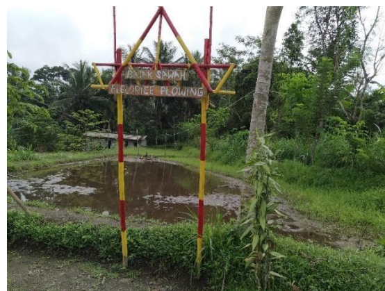
Gambar 1. Lokasi tanam padi dan bajak sawah

Kegiatan wisata tanam padi dapat dilakukan wisatawan pada lahan pertanian di musim tanam seluas 4000 meter. Lahan aktivitas wisata tanam padi menyesuaikan dengan tempat petani yang kosong siap untuk ditanami. Kegiatan tanam padi ini terdiri dari 3 aktivitas besar yaitu bajak sawah, tanam padi dan panen padi. Wisatawan akan diajarkan mengenai proses penanaman padi dari awal sampai menjadi padi dan siap untuk dipanen. Kegiatan tanam padi terdiri dari bajak sawah, edukasi mengenai jenis padi, jarak tanam antar benih padi, tanam padi serta cara memanen padi. Wisatawan yang datang ketika musim panen tiba dapat ikut aktivitas memanen padi dan tradisi syukuran yaitu wiwitan.