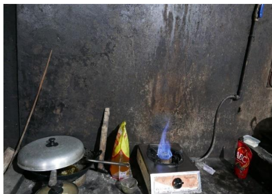
Gambar 3. Kompur dengan Biogas

Menurut wawancara dengan pengelola menyampaikan bahwa “pengembangan biogas di dusun ini sudah dimulai dari tahun 2016, mimpinya seluruh warga pancoh menggunakan biogas di setiap rumah, tetapi kendala dana dan suplai kotoran sapi” BN, wawancara tanggal 5 Juli 2023. Pembuatan biogas harus kotoran sapi yang murni dan tidak boleh tercampur rumput dan bahan lainnya. Bapak Suharjo sudah membuat biogas secara continue untuk digunakan sehari-hari. Wisatawan yang berkunjung dapat melihat penggunaan biogas di rumah Bapak Suharjo. Aktivitas wisata dalam pembuatan biogas yaitu mengambil kotoran sapi dari kandang, kemudian dibawa ke tempat penampungan, proses mengaduk dan fermentasi sampai dapat digunakan untuk menyalakan api.