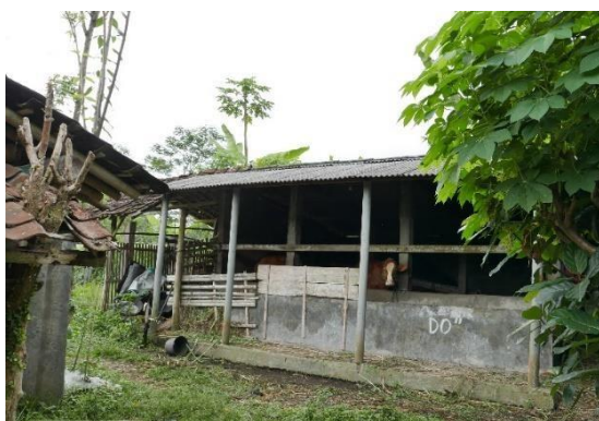
Gambar 5. Kandang Komunal

Aktivitas wisata yang berkaitan dengan peternakan warga yaitu kandang komunal. Wisatawan dapat melakukan kegiatan peras susu kambing Etawa, edukasi tentang guyang sapi, memberikan makan sapi, dan olah biogas. Salah satu pengolahan biogas juga terdapat pada kandang komunal. Wisatawan dapat belajar wisata edukasi pengembangbiakan ternak kambing dan sapi.