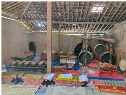
Gambar 10. Instrumen Gamelan

memainkan Gamelan berasal dari leluhur Dusun Pancoh. Peralatan gamelan sudah berumur cukup lama untuk dilestarikan dan disimpan pada rumah tradisional Jawa yaitu Joglo. Wisatawan membutuhkan waktu kurang lebih satu jam dari pengenalan notasi sampai dapat memainkan satu lagu ( gending ) secara bersamaan.