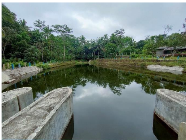
Gambar 4. Embung