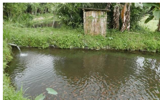
Gambar 7. Kolam pembudidayaan ikan

Aktivitas wisata selanjutnya yaitu tangkap ikan. Wisatawan dapat belajar mengenai paket edukasi perikanan yang terdiri dari pengembangbiakan ikan, cara pembibitan, cara pembesaran harus berapa hari dan cara memberikan makan. Pada kolam ikan wisatawan juga dapat melakukan kegiatan tangkap ikan.