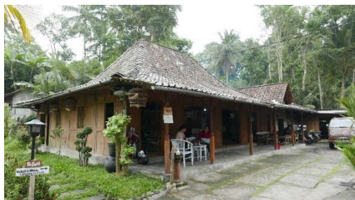
Gambar 8. Omah Partoredjan

Menurut petikan wawancara dengan Ibu Menek pada tanggal 7 Juli 2023 menyampaikan bahwa Omah Partoredjan dibangun dengan membuat MOU sharing profit dari penjualan resto kepada manajemen ekowisata. Jumlah pekerja saat ini yaitu 6 orang yang terdiri dari 3 orang pramusaji, 2 orang tukang masak, 1 orang jaga malam. Konsep yang ditawarkan berupa lokasi tempat makan yang ada di aliran sungai bernuansa kehidupan petani zama dahulu. Bangunan warung berupa rumah adat joglo serta kendang kebo. Selain tempat makan, Omah Partoredjan juga membuka trip VW Safari . Trip VW safari ini bekerja sama dengan destinasi wisata lainnya. Wisatawan akan naik VW start dari warung kemudian berkeliling sesuai dengan trip yang diambil. Perjalanan tersebut ada yang Long , Medium dan Short Trip .