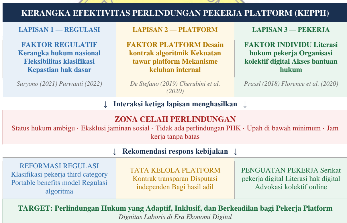
Gambar 2. Kerangka Efektivitas Perlindungan Pekerja Platform (KEPPH)