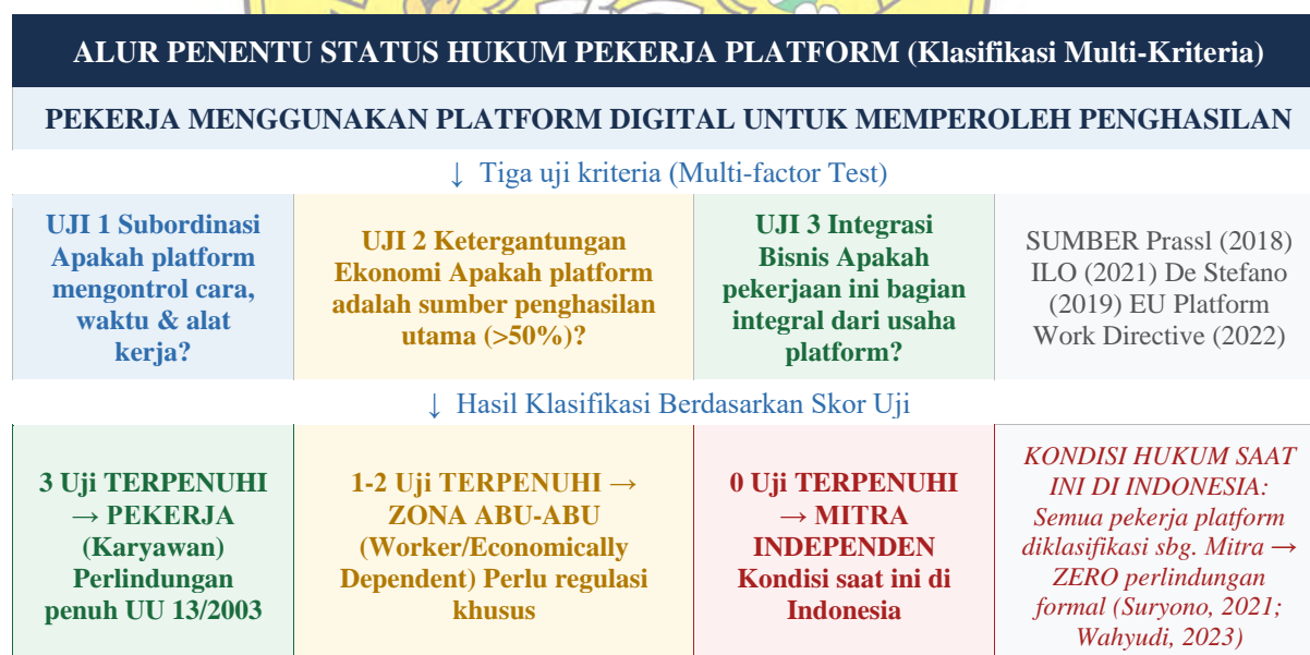
Gambar 3. Alur Multi-Kriteria Penentuan Status Hukum Pekerja Platform