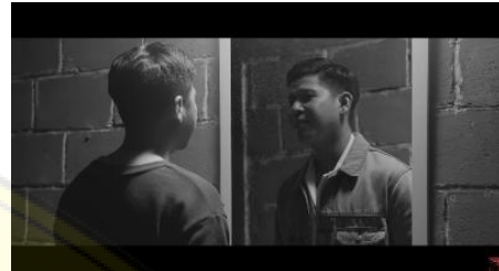
Gambar 4.5 Bayangan Nino berbalik dan tersenyum ke arahnya dalam Si Lemah (3.37-4.09)

“Relakanlah, masih banyak senyum di dunia. Yang bisa terima semua indah kurangmu, bila engkau berbeda. Jangan kau benci dirimu”