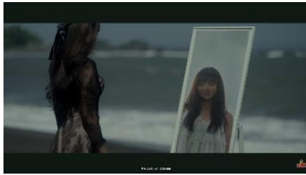
Gambar 4.4 Bayangan Ghea yang mengenakan dress putih tersenyum ke arahnya dalam Jiwa yang Bersedih (4.34-5.13)

“Selama ini kau hebat, hanya kau tak didengar”