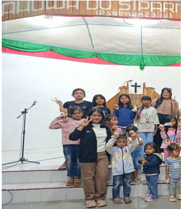
gambar 3. 1 perayaan paskah setelah pembinaan