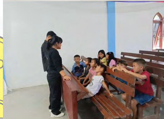
gambar 2 1 pembinaan. Anak-anak sekolah minggu