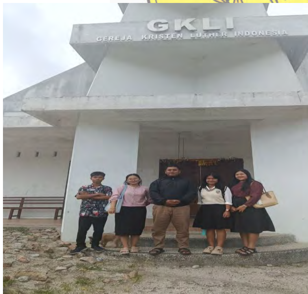
gambar 1.1 observasi awal 1