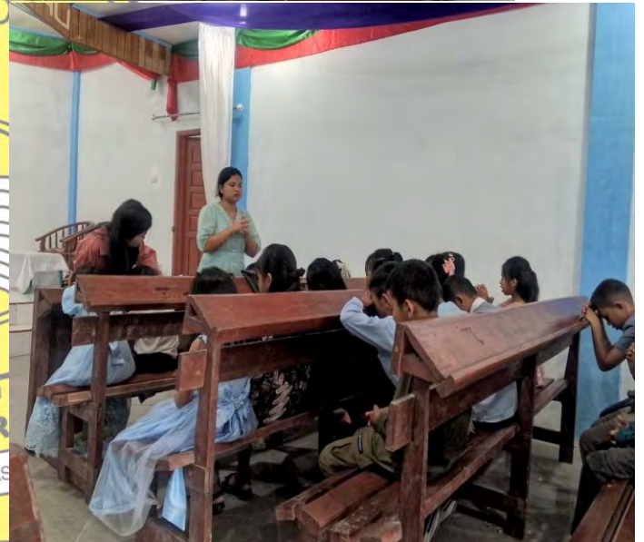
gambar 4. 1 dokumentasi pembinaan