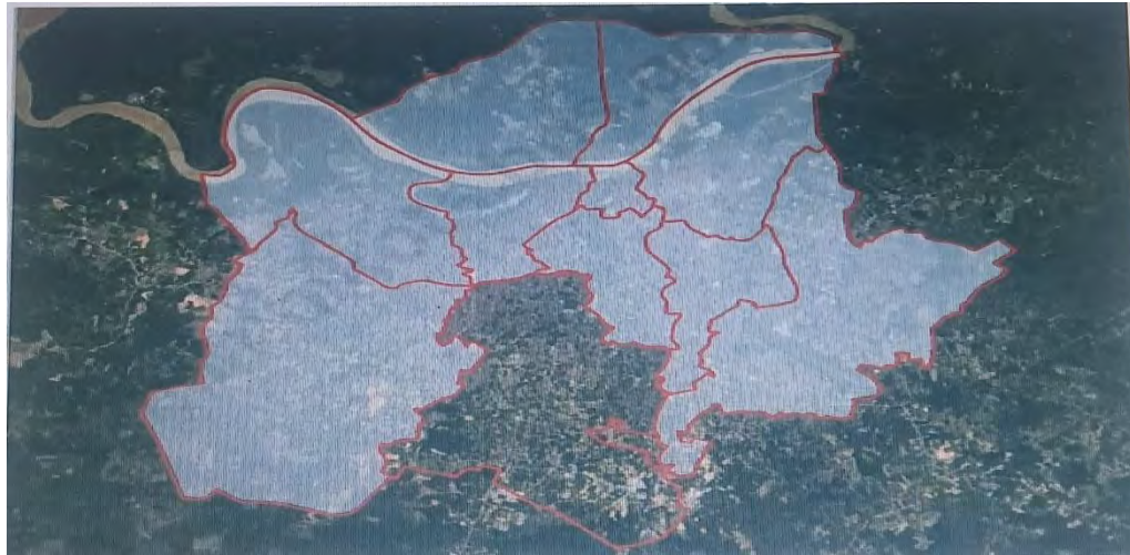
Gambar 1. Peta Kecamatan Kotabaru

Gambar 1 di atas menunjukkan peta wilayah administratif Kecamatan Kotabaru yang berada di wilayah Kabupaten Ende. Peta tersebut menggambarkan batas-batas wilayah serta pembagian area dalam kecamatan, sehingga dapat memberikan gambaran mengenai letak dan kondisi geografis daerah tersebut. Melalui peta ini dapat diketahui bagaimana bentuk wilayah, posisi desa-desa, serta jaringan wilayah yang ada di Kecamatan Kotabaru. Informasi peta ini penting untuk memahami kondisi geografis wilayah yang menjadi dasar dalam perencanaan pembangunan dan pengelolaan wilayah oleh pemerintah daerah.