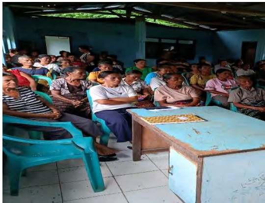
Gambar 3. Pelaksanaan mediasi musyawarah secara adil dan terbuka

perdamaian di Desa Tou bukan pada "siapa yang paling benar secara sejarah", melainkan pada "kepastian status tanah" dan "pemulihan harga diri" kedua belah pihak melalui pernyataan tidak ada yang menang atau kalah.