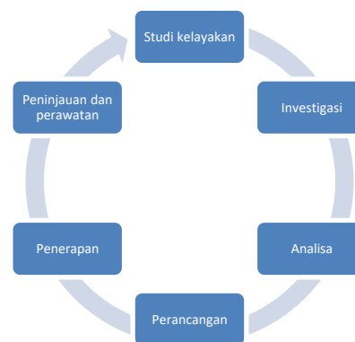
Gambar. 1. SDLC ( system development life cycle ). (Sarosa, 2017)

Penelitian ini menggunakan sebuah metodologi pengembangan perangkat lunak SDLC ( system development life cycle ) atau biasa disebut juga waterfall . SDLC memiliki enam tahapan yaitu studi kelayakan, investigasi, analisa, perancangan, penerapan, serta peninjauan dan perawatan.(Sarosa, 2017) Namun dalam penelitian ini hanya dibatasi sampai tahap penerapan, dikarenakan penelitian ini masih merupakan penelitian awal yang nantinya akan dikembangkan lebih lanjut.