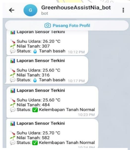
Gambar 5 Notifikasi Telegram

Secara keseluruhan, hasil evaluasi menunjukkan bahwa sistem monitoring ini layak digunakan dan mampu menjalankan fungsinya dengan baik sesuai tujuan penelitian. Meskipun terdapat beberapa keterbatasan seperti ketergantungan pada jaringan Wi-Fi dan tingkat akurasi sensor yang masih dapat ditingkatkan, sistem ini telah memenuhi kebutuhan utama sebagai alat bantu